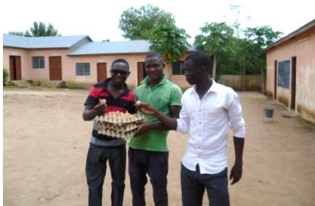
Des plateaux d'œufs quotidiens grâce au programme agro-pastoral