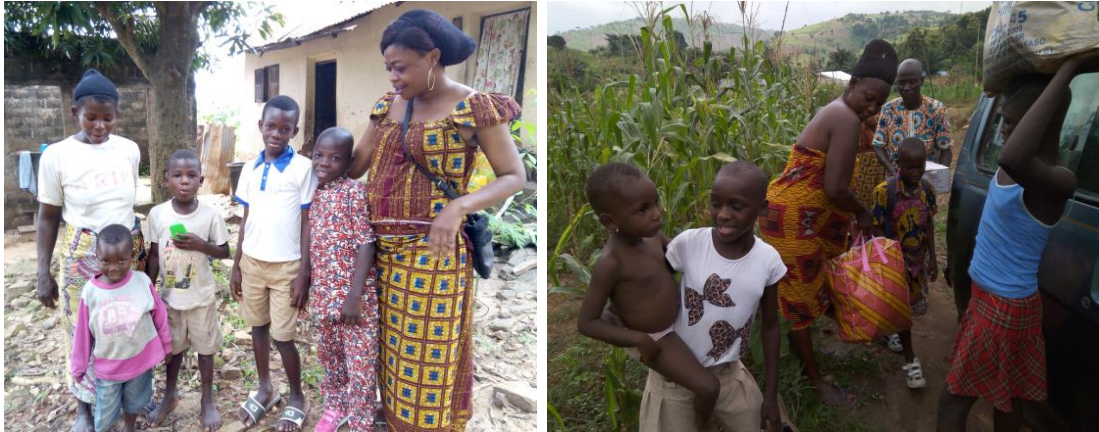
Retour des enfants chez des membres de leurs familles