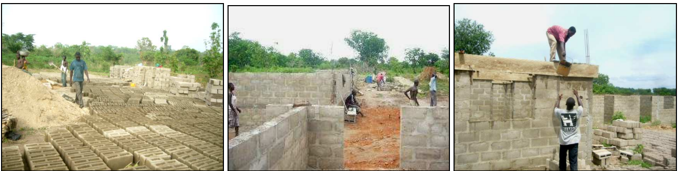
Progression de la construction du centre d'accueil Inauguration du puits principal et réalisation de la route de l'orphelinat

Cette année 2011 - 2012 marque pour nous le début de la réalisation d'un rêve, celui que nous avons dès le démarrage du programme : créer un centre d'accueil pour les enfants défavorisés. Pour y parvenir, le chemin fut long, avec d'abord l'acquisition du terrain, puis la négociation du permis de construire et le choix d'une société de construction fiable. Ce centre pourra abriter 30/40 enfants de manière permanente et autant en accueil de jour. Il inclura 10 chambres d'enfants (pour 3 à 4 lits), un réfectoire, 12 WC/salles des bains, une salle de jeu, une bibliothèque, une paillote centrale pour les activités communes, une salle d'accueil de jour, etc. Actuellement, sur 6 phases de construction, 3 sont déjà achevées et la 4 ème est en cours. Les travaux seront terminés fin octobre, l'électrification et l'ameublement du complexe commenceront alors. Il sera inauguré en février 2013, nous invitons tous nos parrains et donateurs à prendre part à cet évènement.