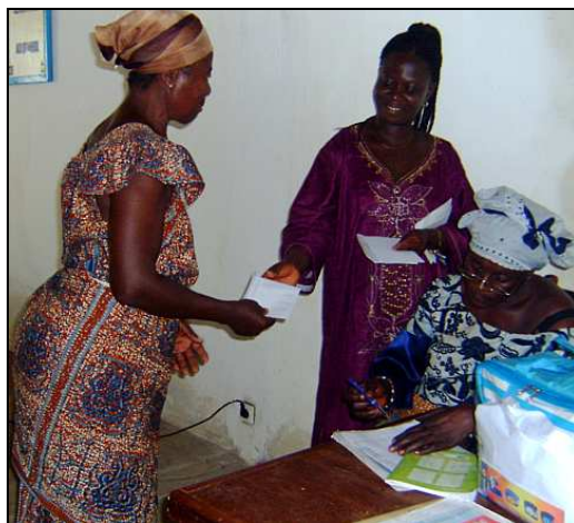
Remise d'une somme forfaitaire de soutien aux AGR pour chaque veuve suite à la formation