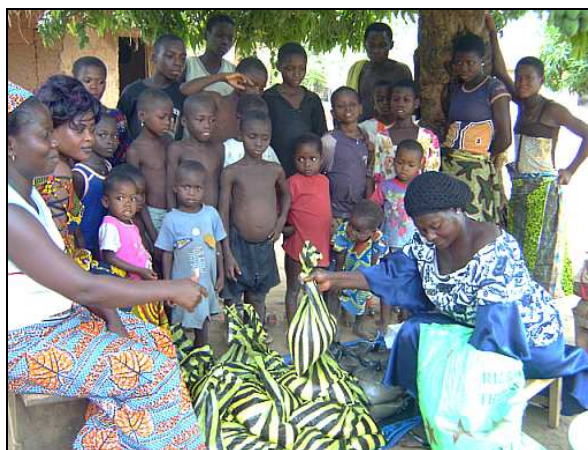
Distribution des kits alimentaires aux enfants avant les élections