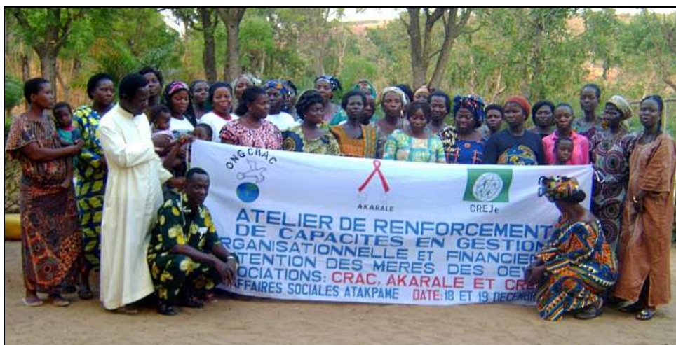
Formation en gestion pour les veuves chargées de famille

guidé dans le contexte de cette formation de base d'une durée de deux jours (les 18 et 19 décembre 2009).