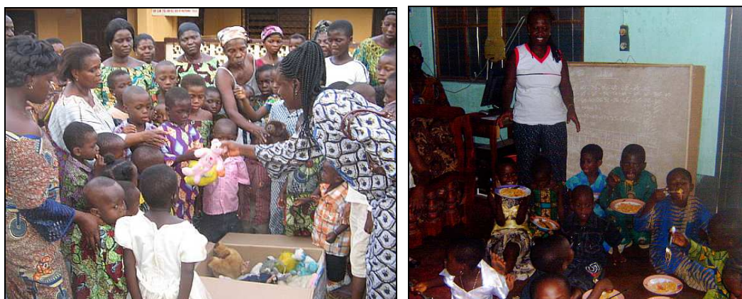
A gauche : enfants réunis pour la remise des cadeaux à Noël A droite : enfants lors du repas de Pâques

Nous avons aussi organisé divers évènements pour distraire les enfants, notamment une fête à Noël avec remise de cadeaux et une petite fête à Pâques.