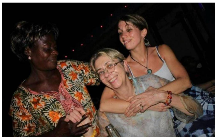
Visite au Togo en 2013