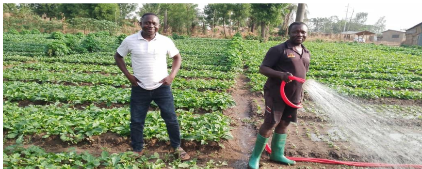
Activité Maraîchage pour la famille d'accueil des sœurs OBE et ATSOU