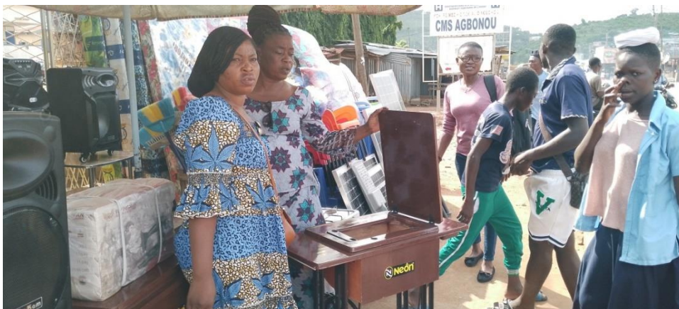
Achat de machine à coudre pour une Famille d'Accueil