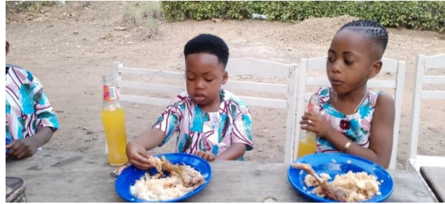
Repas de Noel pour nos enfants et leurs Familles d'Accueil