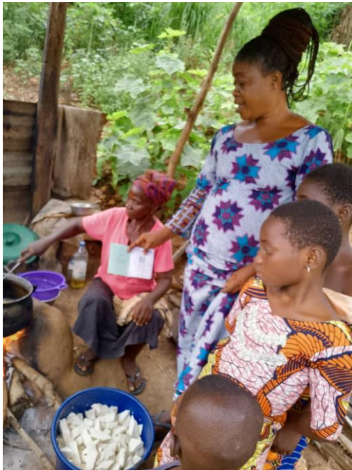
AGR de la Famille d'Accueil des Sœurs MATTI (Fabrication de fromage)