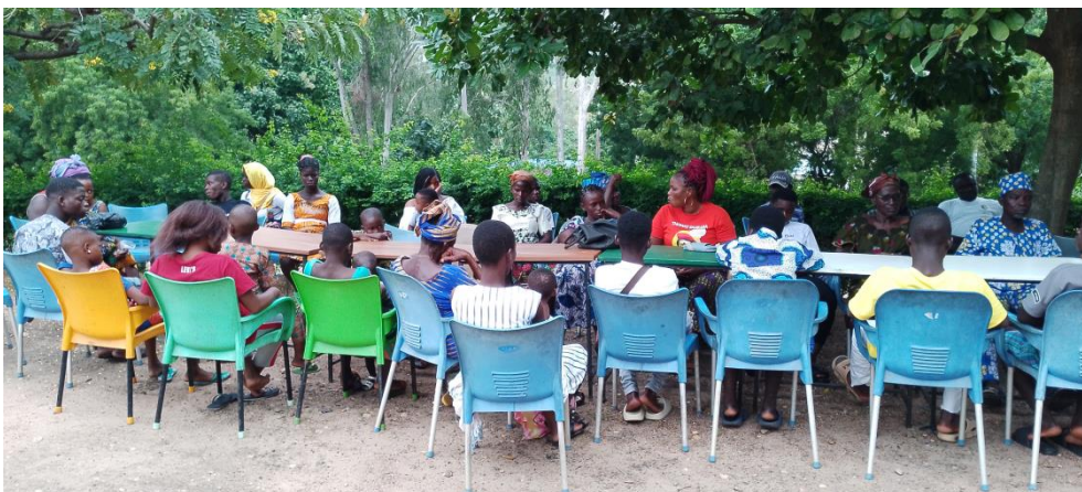
Groupe de travail des familles sur la Non-violence et le Développement personnel