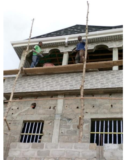
ATIKPE Armel continue sa formation professionnelle en Carrelage