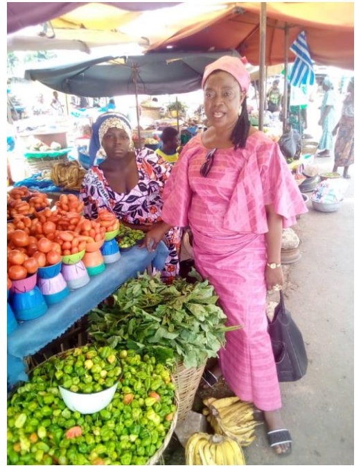
AGR de la Famille d'Accueil OKESSOU (vente de légumes au marché)