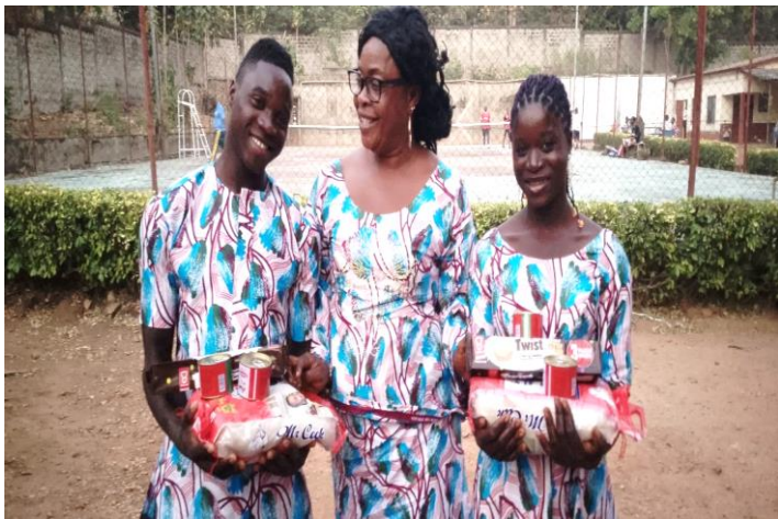
Les Kits de Noel pour nos enfants